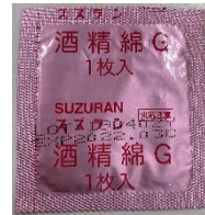
③酒精綿 (消毒用アルコールシート)